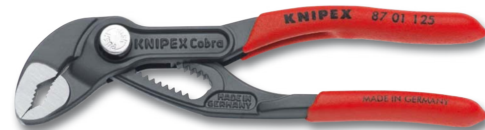
87 01 125 Рисунок 1:1